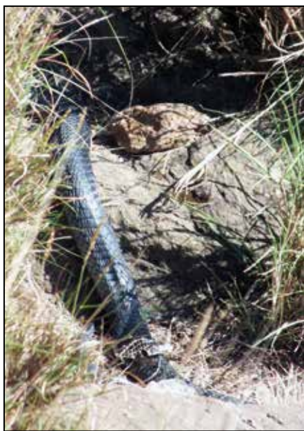
Jos liikut Afrikassa, tämä ei sitten ole Tapolaa!

Olimme seisahduneet Suuren Hautavajoaman jyrkänteelle ja kuvasin parhaillaan nuolihaukkaa. Kuskimme Moses oli nti J:n kanssa noin 10 metrin päässä ja parahti äkisti "black mamba". Äijä otti jalat alleen niin nopeasti, että kun ääni saavutti minut, katseeni ei enää tavoittanut miestä. Nti J laski kameran silmiltään ja tapasi kolmimetrisen, miehen hauksen paksuisen käär-