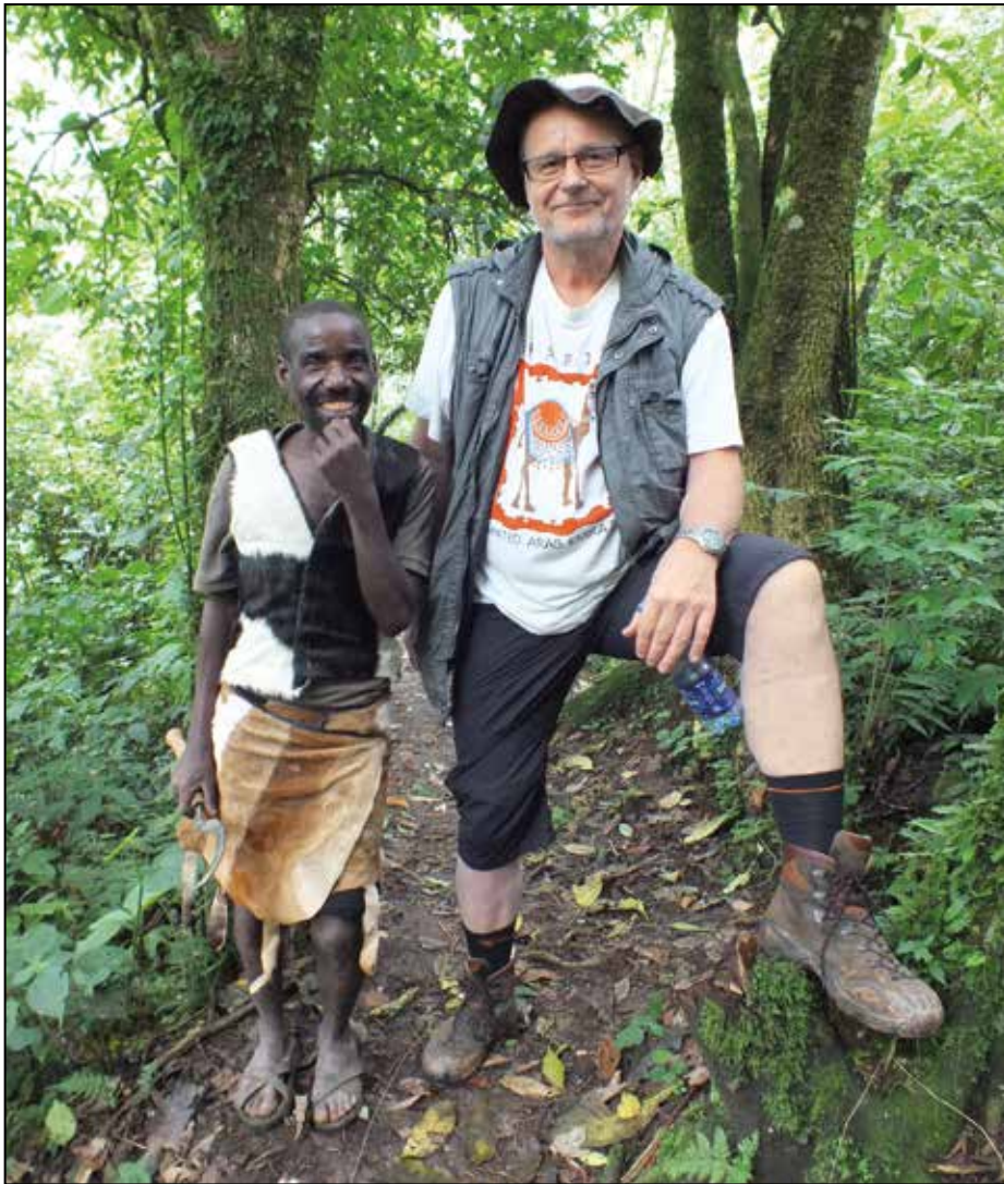
Sademetsissä asuvia batvoja on syrjitty, mutta ugandalainen hymy on herkässä. Lainasin kaverin hattua peittääkseni ruandalaisen parturin työn jäljen - ja jotten näyttäisi niin pieneltä.

iski edeltäneenä yönä punkki itseäni paikkaan, jota en kerro. Maastoon päästyämme tapasimme joukon harvinaisimpia nisäkkäitä: Valkoisia sarvikuonoja, puuhun kiipeäviä leijonia, Rotchildin kirahveja, mutta myös käärmeistä vaarallisimman; mustamamban.