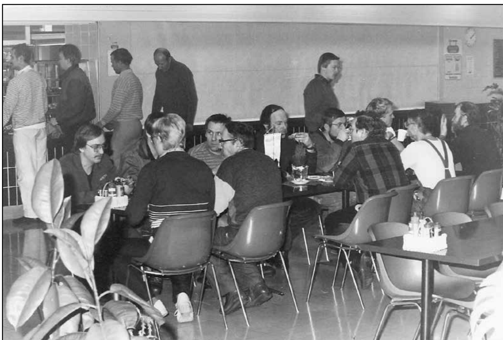
Ammattimiehiä ruokalassa vuonna 1986