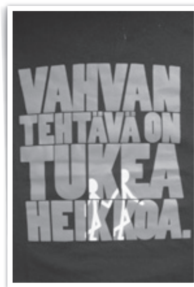
Ay-liike ei unohda solidaarisuutta