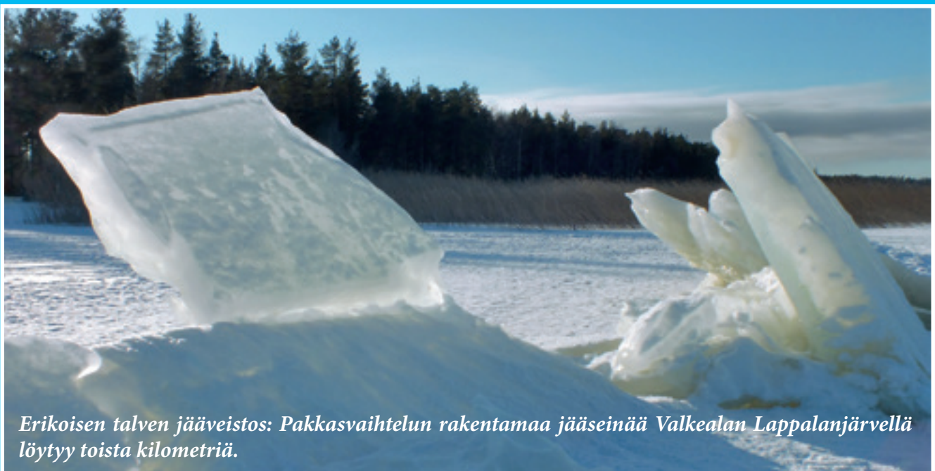
Erikoisen talven jääveistos: Pakkasvaihtelun rakentamaa jääseinää Valkealan Lappalanjärvellä löytyy toista kilometriä.