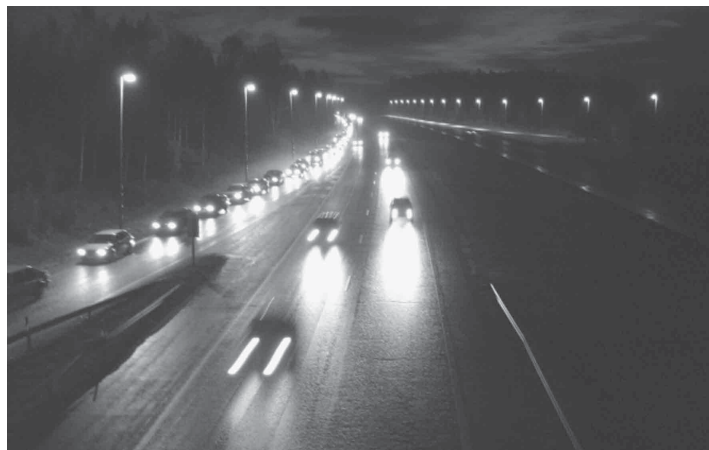
Ohitse kiitävä liikenne ja seisova jono muodostavat etenkin pimeässä suuren riskin

Tiellä on 50 km/h nopeusrajoitus, jota on syytä noudattaa. (HAT/HLT)