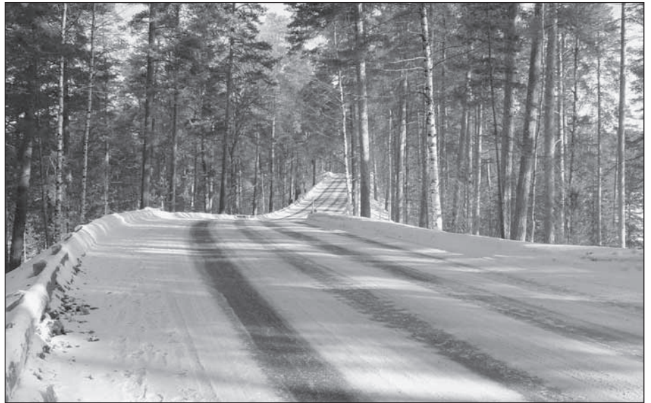
Punkaharjun vanha tie, osa talvista kansallismaisemaa

Lomakeskuksen läheisyydessä sijaitsee myös Punkaharjun kuntoutuskeskus Kruunupuisto tarjoten monenmoisia aktiviteetteja ja elämyksiä. Jos ei avantouinti kiinnosta, niin tarjolla on kylpylän/uimahallin palvelut kuntosaleineen ja moninaisine hoitomahdollisuuksineen. Ruoka on kuulemma hyvää ja