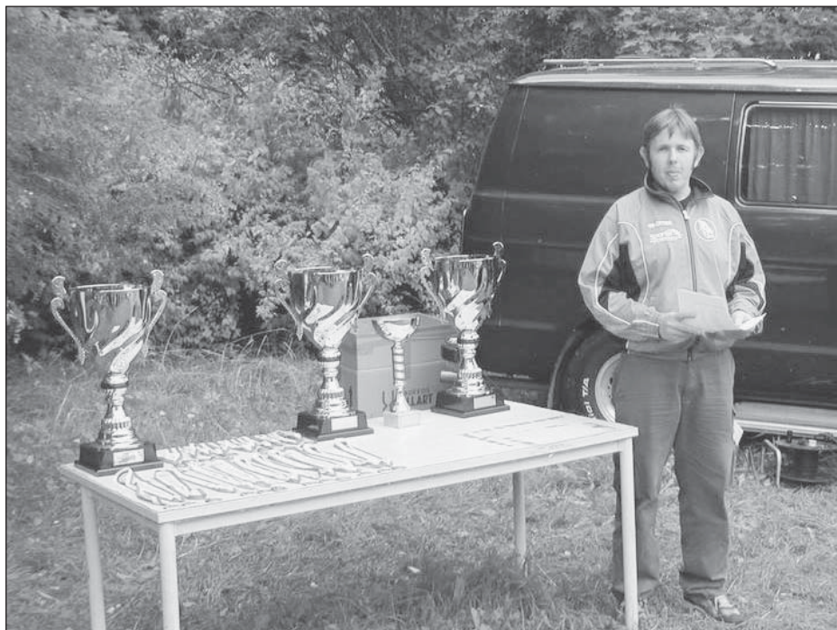
Joskus Jussi pääsee jakamaan isojakin pokaaleita

Pari vuotta sitten viimeksi välitin haasteen kuntopyöräilyyn, johon yhtiömme ei voinut kustantaa edes parin kympin osallistumismaksuja! Samana vuonna pisti kyllä silmään, että kalliimpiin ja täysin kaupalli-