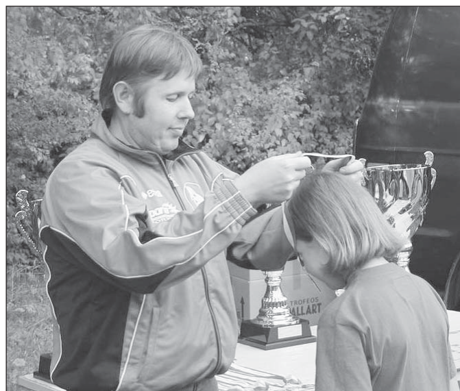
Puheenjohtaja jakamassa palkintoja kuolulaispyöräilijöille syyskuussa. Nuorille polkijoille Akilleessa on aina riittänyt idoleita

- Seuraava suuri haaste on SM-kisat 2005 jotka olemme saaneet järjestettäväiksemme. Reitti tulee olemaan ennennäkemätön 10,2 km rata, joka kiertää Porvoon keskustaa akselilla Jokikatu - Aunela - Joonaanmäki -Huhtinen - Magnusborg - Kirkonmäki ja työväentalon kautta Jokikadulle. Reitti kierretään 20 kertaa ja testattuumme sen, totesimme sen varmasti raskaimmaksi reitiksi, mitä aikoihin SM-kisoissa on ajettu.