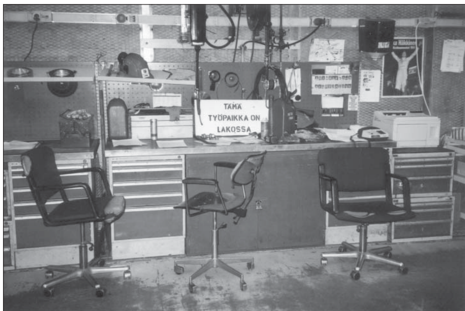
Työntekijöiden toivomuksena on, ettei kuvassa näkyvää kylttiä enää tarvittaisi käyttää neuvottelujen tukena.

Borealis ei ole ollut kiinnostunut neuvottelemaan ulkoistamistoiminoista luopumisesta. Elokuussa käynnistyivät tiiviimmät neuvottelut yhteisymmärryksen löytämistä henkilöstöä koskevassa asiassa. Neuvotteluja käytiin tiiviisti ammattiosaston ja Borealoksen ja ammattiosaston ja Rapidon välillä. Viimeisimmät kirjaukset saatiin sovituksi 28. lokakuuta aamulla, kun il-