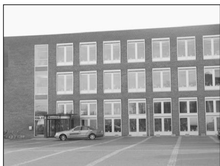
Lyngbyn pääkonttori vaikenee nähtävästi ensi kesänä

Pääkonttorilaisilla ei mene yhtä hyvin, kun ensimmäinen strateginen muutos uusien omistajien aikana oli alkaa valmistella konttorin siirtoa Kööpenhaminasta Wieniin. Muista vaihtoehdoista punta- roitiin Brysseliä, Mecheleniä ja Lontoota. Kun katsoo viime vuosien investointien päävirtaa, ei siinänsä ollut suuri yllätys se, että toiminnot menevät omistajan luo eikä päinvastoin. Lyngbyssä työskentelee noin 80 henkilöä, joista puolet ihan tavallista konttorihenkilökuntaa. Konttori on helppo siirtää, paljon helpompi kuin tuotantolaitos. Alustavasti osa väestä olisi valmiita muuttamaan Itävaltaan, loput joutuvat etsimään uuden sponsorin.