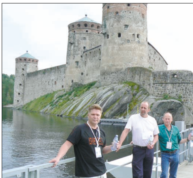
Pekemalaisia Olavinlinnan sillalla

Kauniina kesäviikonloppuna Savonlinna on edustava kappale Suomea samoin kuin koko seutu maisemineen. Liittoon on liittoutunut uutta väkeä, mutta alkavatko vanhat jo väsyä? Pekemalaisten bussi teki matkan Savon maalle kovin vajaana. Osanotto alkaa pudota alle kipurajan, mutta he, jotka osallistuivat, saavat taas kerran muistella retkeä hilpein mielin. Käyttöön oli varattu koko upouusi Kerimaan metsähotelli upseine huoneistoineen. (HLT)