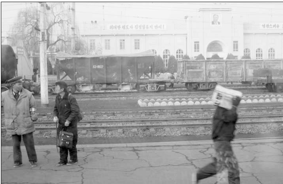
Junan ikkunasta nähtyä reaalielämää asema-alueella Pohjois-Korean puolella.

Jutustelun edetessä he näyttävät maahantulokaavakkeet, jotka on seuraavana aamuna täytettävä Dangdongissa Pohjois-Korean rajalle tullessa. Pyydämme saada ne heti, kun vielä pystymme kirjoittamaan. Vanhempi konnari sanoo,