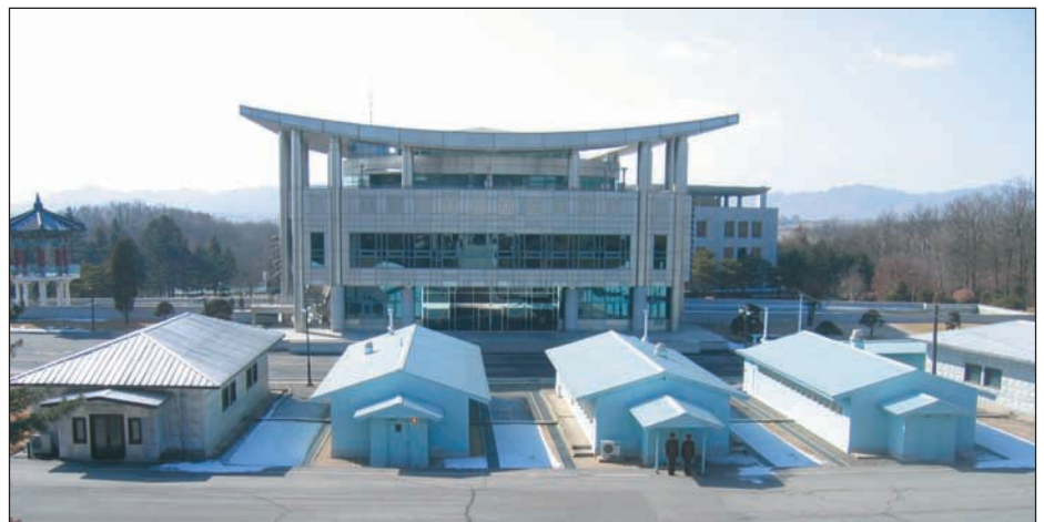
Parakissa, joka on vartioitu, neuvoteltiin vuonna 53 leveyspiiri 38:n sopimuksesta. Taustalla amerikkalaisten DMZ-komentokeskus.