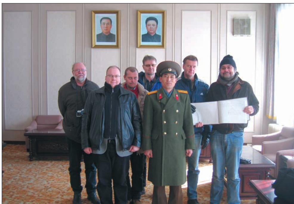
Isäntä, suomalaisvieraat ja vieraskirja Pohjois-Korean DMZ-esikuntarakennuksen salongissa.

Siivous kuuluu vuokraajalle (itse tai palvelunosto infosta). Tupakointi on kielletty molempien loma-asuntojen sisätiloissa. Osake 5:een on eläinten vieminen ehdottomasti kielletty.