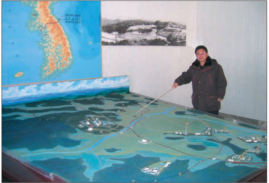
Oppaamme esittelemässä Panjumjomin pienoismallia.

metrin kaista. Tulemme takaisin pihalle. Olin laskenut jenkkien suunnan ainakin 7 videokameraa meidän suuntaamme, mutta sen lisäksi havaitsemme parakkien väliin haara-asentoon asettuneen maastopukuisen sotilaan. Hän kuvaa meitä julkeasti parinkymmenen metrin etäisyydeltä. Arvelemme, että ihan heti ei kannata hakea USA:n viisumia. Vai olivatko kuvat menossa sotilaan perhealbumiin ihailtaviksi, kun hän istahtaa sohvalle vaimon ja Bourbonlasin kanssa kynttilän valossa Massachusettsilaisen veteraanitalon kirjastohuoneen punapyökkinen pöydän ääreen?