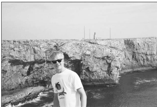
Timppa Portugalissa 1991

Alkuhässäkässä emme paljon ehtineet jutellakaan, asuttiin eri tuvis-sa. Mutta juhannusaattona päästiin vähän rennompaan illanviettoon