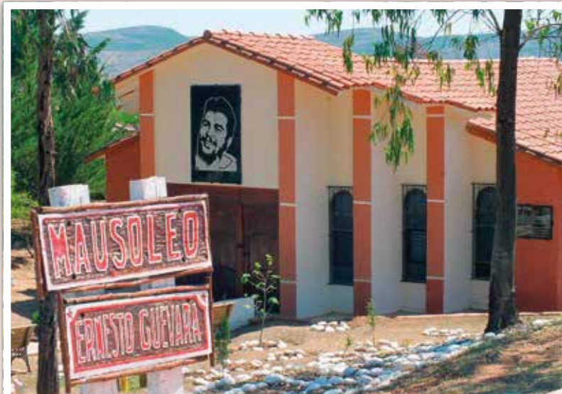
Chen v. 1997 paljastuneen hautapaikan päälle on rakennettu mausoleumi, jonka kaivantoon kävijöillä on tilaisuus laskeutua

Che vetää kävijöitä Vallegrandeen. Syvimmän vaikutuksen silti tekee Chen kohtaloksi koitunut kyläpahanen syvällä vuorten keskellä.