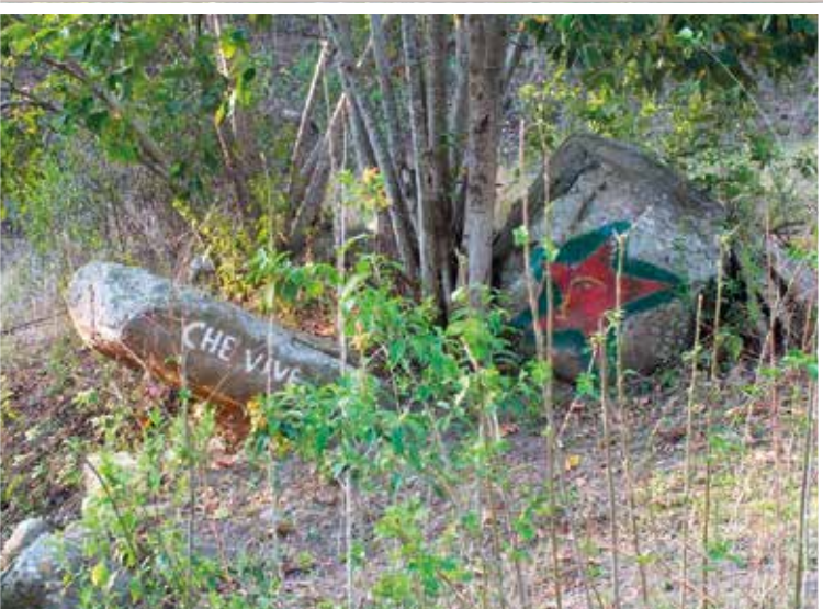
Näiden kivien suojissa haavoittunut Che Guevara koki vapautensa viime hetket