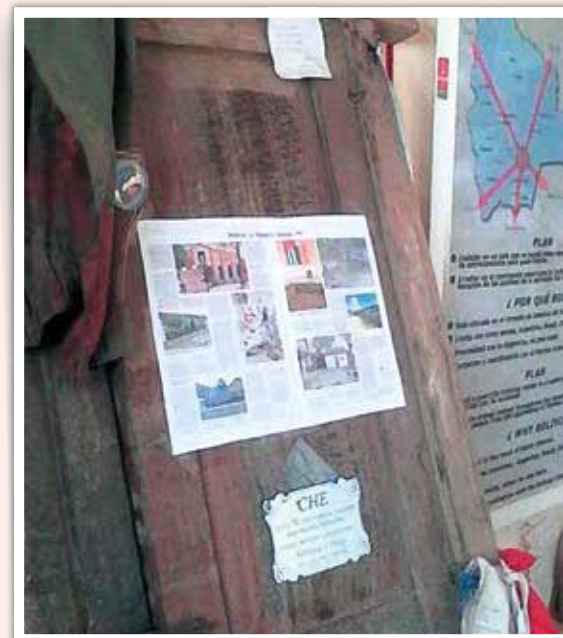
Chen teloituksen aikaan 51 vuotta sitten käytössä ollut luokkahuoneen ovi, johon kiinnitettynä museossa kävijä voi lukea suomenkielisen kuvareportaasin Ruta del Chestä