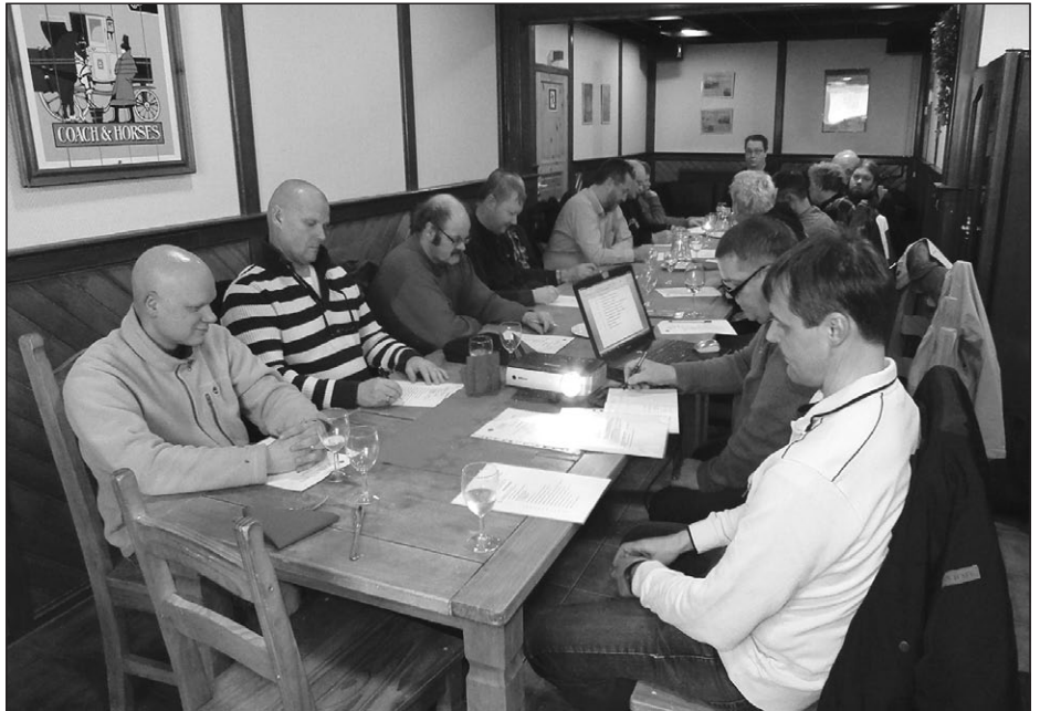
Marraskuun jäsenkokous keräsi taas mukavasti osallistujia.