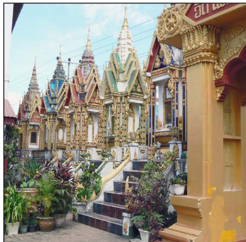
Pakxen päätempelin rakennelmia Laosissa

Pakxessa törmäsimme jälleen periaasialaiseen tapaan neuvoo, kun kysyimme tietä tunnettuun Hotel Lankhamiin. Koskaan aasialaiset eivät sano, etteivät tiedä. He ovat tietävinään ja neuvovat vain