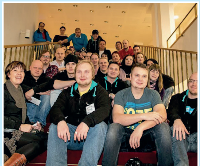
Nuorisovastaavapäiville osallistui kolmisenkymmentä toimeliasta aktiivia