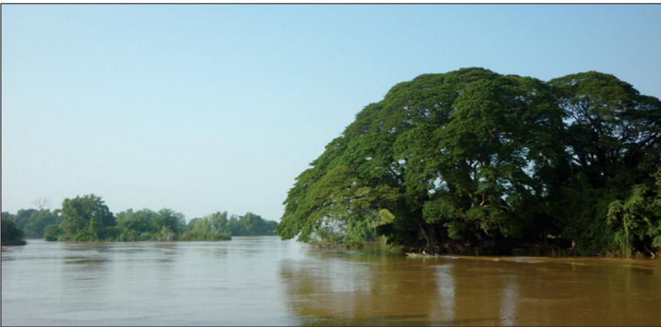
Mekong-joki kuljettaa vettä aina Tiibetin ylängöltä asti ja laskee Vietnamissa Etelä-Kiinan mereen