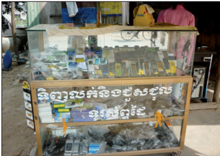
Kampong Chamissa kadunvarressa Nokia lähtee halvalla

Olimme saapuneet Indokiinan köyhimpään, mutta ympäristöltään rikkaimpaan Laosin demokraattiseen tasavaltaan, jonka metsät elävät hyvää elämää ja jossa on suunnattoman runsas lajisto. Metsiä ei