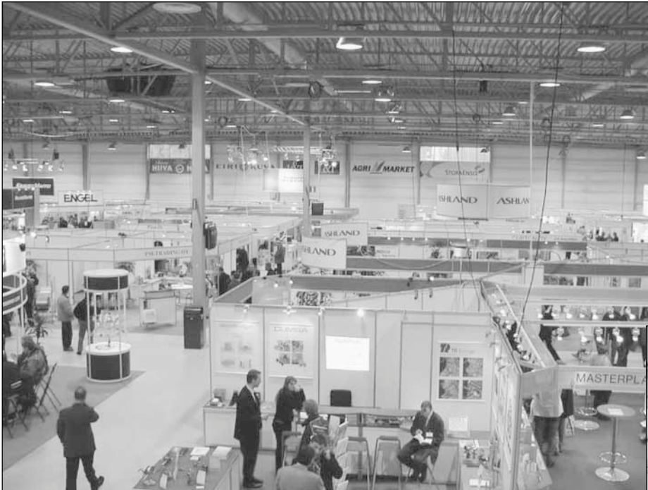
Lahden tämänvuotisten muovimessujen paristasadasta näytteilleasettajasta Ashlandin standi oli yksi suurimmista.

Toijalalainen Extron on laitevalmistaja, joka myy filmin valmistukseen käytettäviä laitteistoja kiihtyvällä vauhdilla etenkin Venäjälle ja Baltiaan. Sen tuoma mielenkiinto on siinä, että laitevienti käy käsi kädessä muovin kaupan kanssa edistäen samalla muovin vientiä. Extronin edustaja kertoi Suomen omien laitemarkkinoiden olevan aika lailla kylläiset. Jonkin verran uusitaan laitekantaa, mutta suurta uusrakentamista ei kotimaassa ole. (HLT)