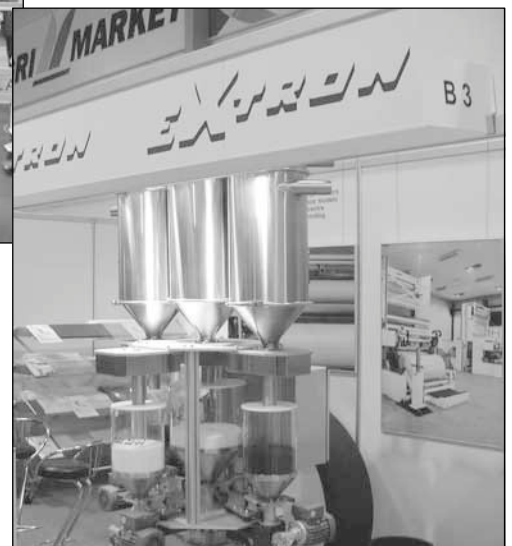
Extron myy filmin valmistukseen tarvittavia laitteistoja