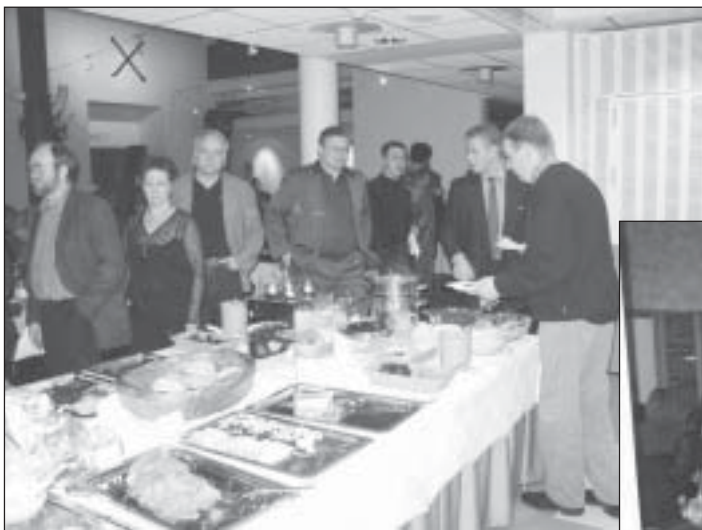
Iriksen tuoreita herkkuja jonottamassa