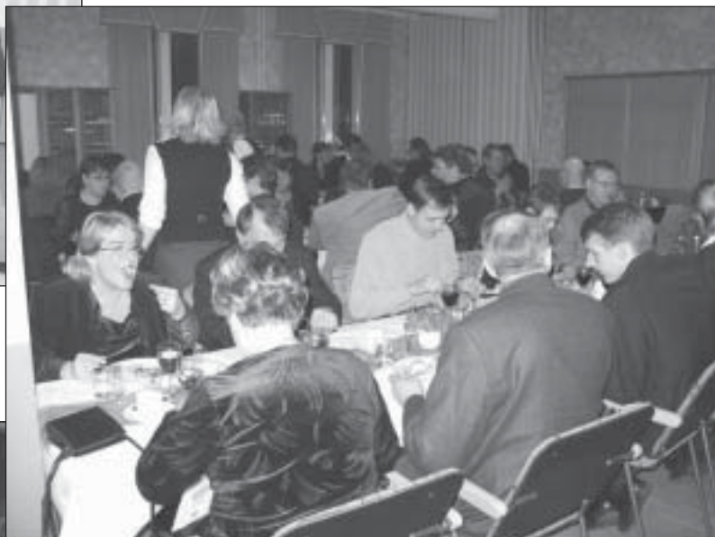
... kyllä tätä on odotettukin