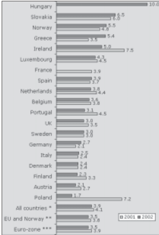
Keskimmäiset työehtosopimuskorotukset prosentteina 2001-2002.