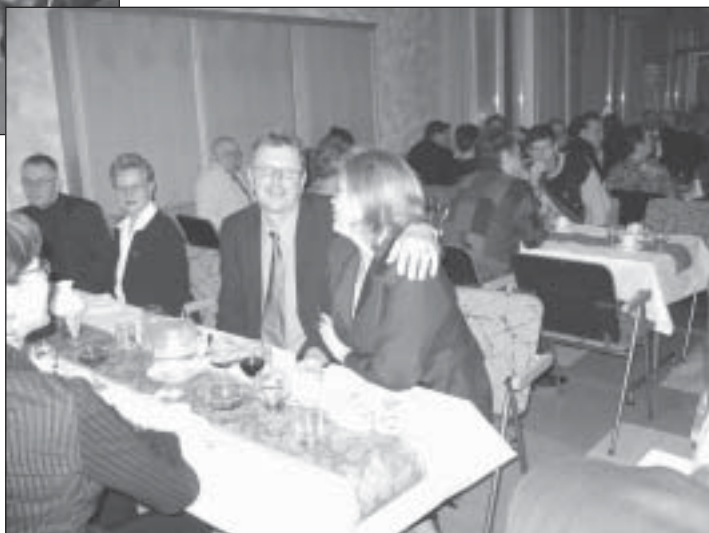
... ja jälkiruoka konjakiksi