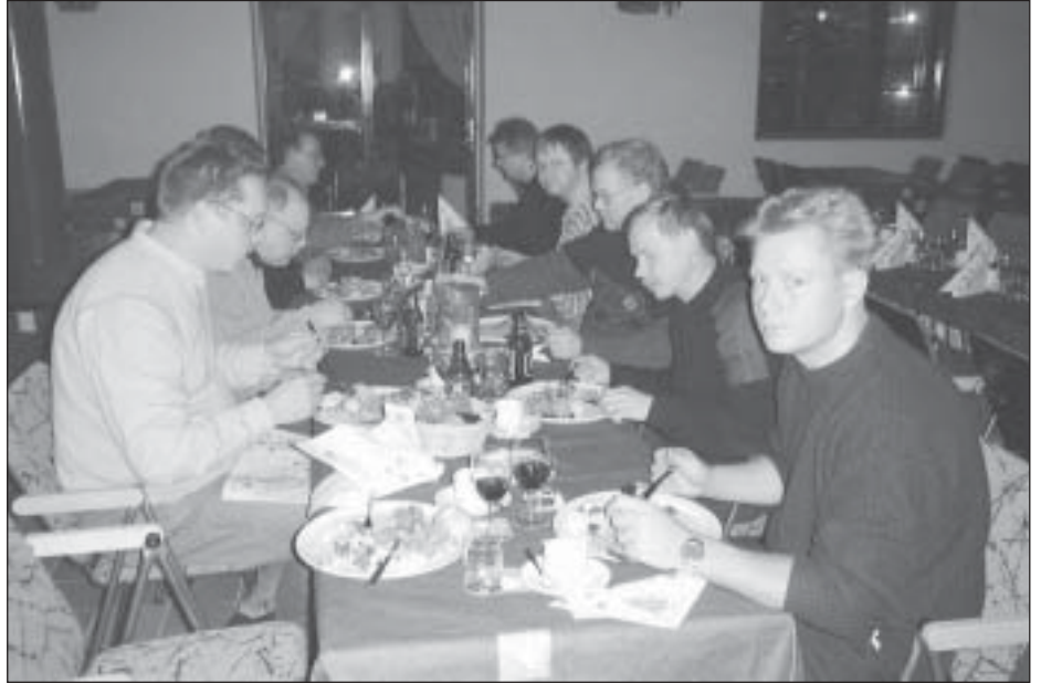
Kokousväen illallinen Iriksessä