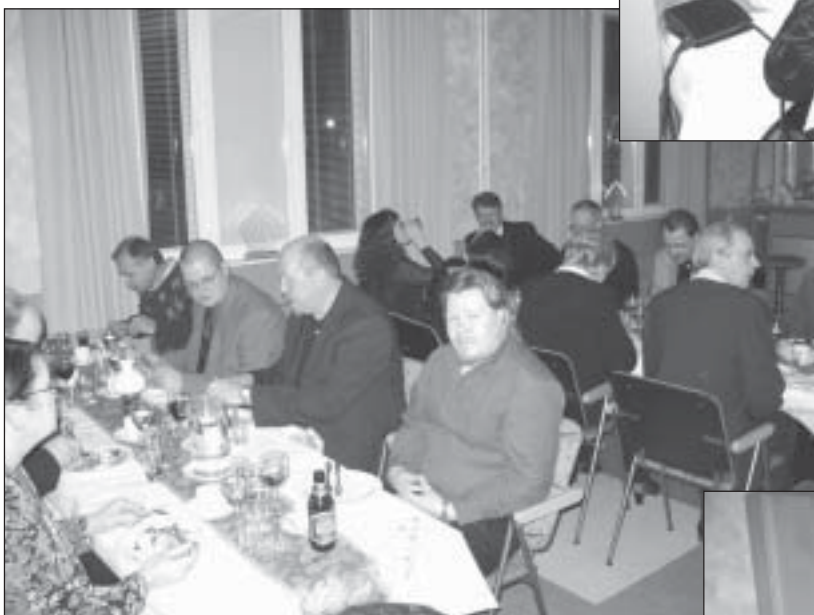
Nälkä muuttui janoksi...