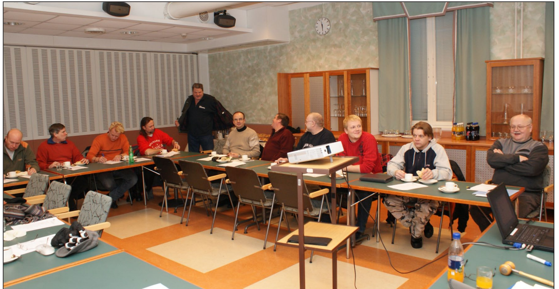
Ammattiosaston syyskokous pidettiin 29.11. ravintola Iriksen tiloissa.

Pekeman Työntekijöiden ja Porvoon Öljynjalostamon Työntekijöiden syyskokousten yhteinen kannanotto harmaan talouden häätämiseksi Kilpilahdesta: